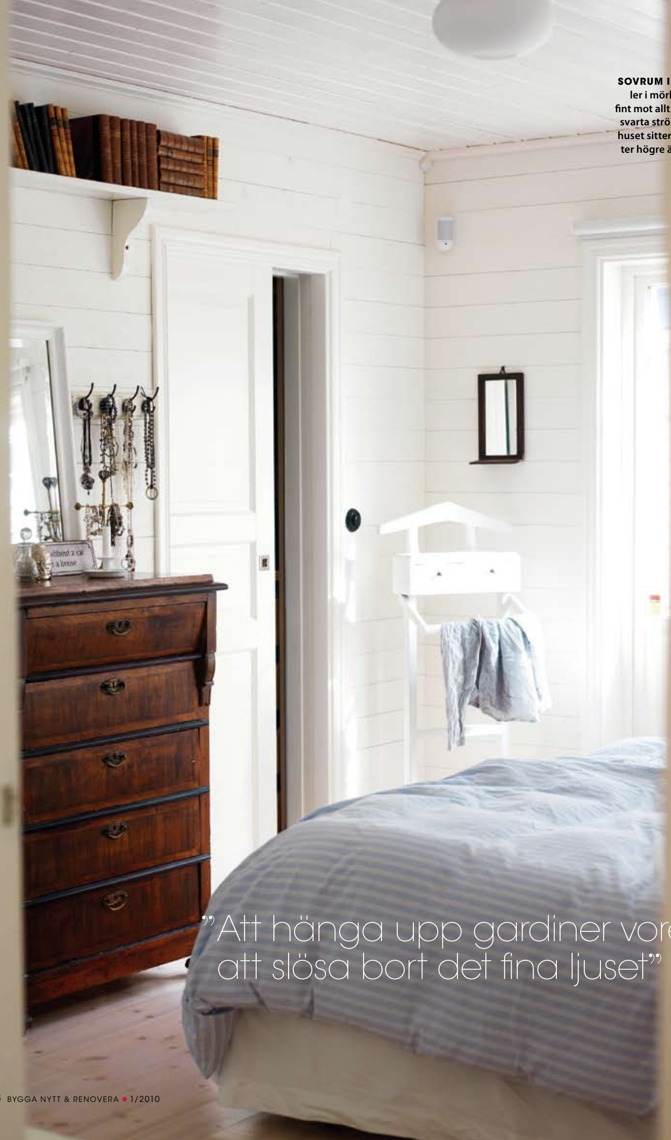
SOVRUM I VITT. Möb- ler i mörkt trä bryter fint mot allt det vita. De svarta strömbrytarna i huset sitter en decime- ter högre än standard.

”Att hänga upp gardiner vore att slösa bort det fina ljuset”