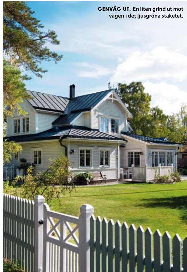
GENVÄG UT. En liten grind ut mot vägen i det ljusgröna staketet.